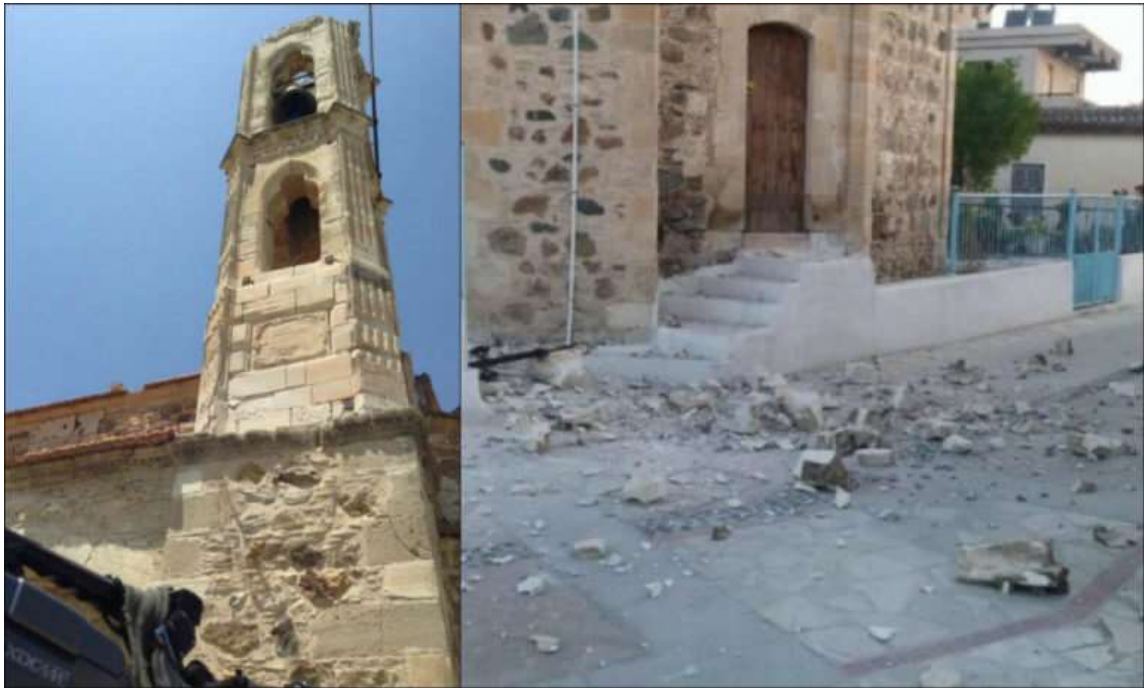
Φωτογραφικό υλικό από τον σεισμό των 6,5 Ρίχτερ στην Κύπρο (Πάφου) το 1996.

M=6.5 ρίχτερ με επίκεντρο ευτυχώς τον θαλάσσιο χώρο, περίπου 50km νότιο-δυτικά της Πάφου.