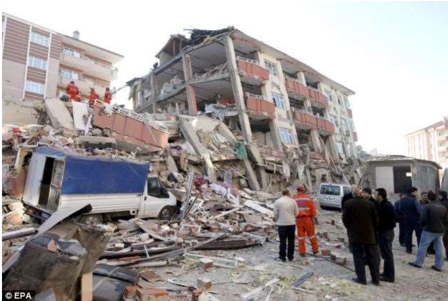
Φωτογραφικό υλικό από τον καταστροφικό σεισμό των 7,1 Ρίχτερ στην Τουρκία το 2011.