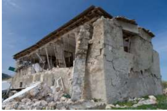
Φωτογραφικό υλικό από τις επιπτώσεις του σεισμού 6,1 βαθμών στην κλίμακα Ρίχτερ, στην Κεφαλονιά το 2014.